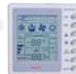
Проводной пульт ДУ в комплекте